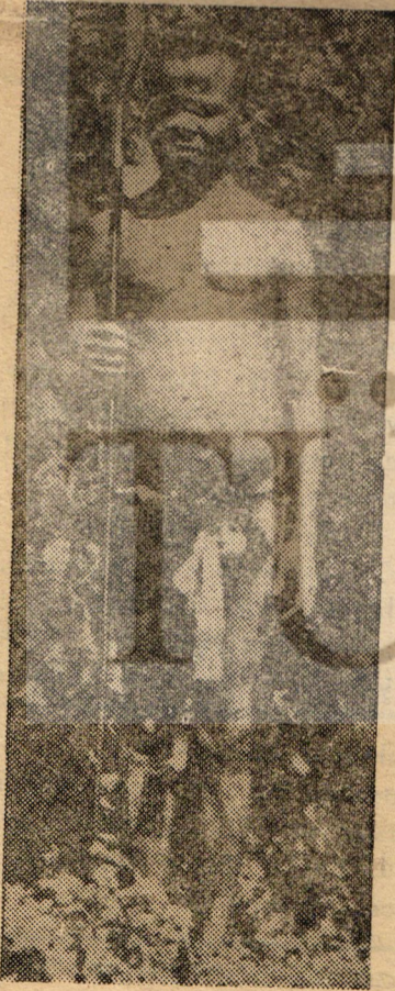
AFRİKALI BİR ÇOCUK Yarının solcusu

—Boş ver! toprak refor mu falan çıkmaz. Çıkarırsa da 100 bin liralık araziye 1 (Devamı 4 de)